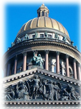
Cattedrale S. Isacco