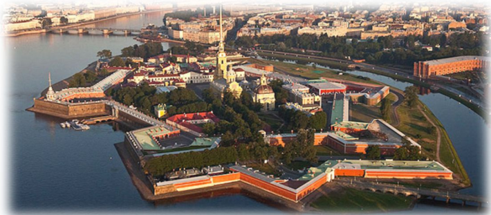
Fortezza SS Pietro e Paolo

Pensione completa. San Pietroburgo, la metropoli più nordica d'Europa, con i suoi 5 milioni di abitanti sorge sul delta del fiume Neva. La città, elegante e misteriosa è frutto della grandezza ma anche della tirannia dello zar Pietro Il Grande, in soli trecento anni è entrata a far parte della storia per la sua bellezza, per il suo splendido museo, per i suoi cittadini, per la sua sofferenza. Mattina dedicata alla visita panoramica di S. Pietroburgo : il Piazzale delle Colonne Rostrate, la Piazza del Palazzo, la Prospettiva Nevski, il Campo di Marte (splendido giardino), la Colonna di Granito. Nel pomeriggio visita della Fortezza dei SS. Pietro e Paolo (ingresso incluso) così chiamata in onore dei santi protettori degli zar, voluta come fortezza da Pietro il Grande. Pernottamento.