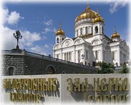
Cattedrale di Cristo Salvatore

Nel pomeriggio visita del Territorio del Cremlino , sorto sulla scoscesa riva sinistra della Moscova, è il nucleo più antico della città. Il perimetro delle sue mura è di circa 2 km, coronate da merli ghibellini e da 20 torri in mattoni rossi, la Piazza Rossa si estende lungo le mura orientali del Cremlino ed è la più antica di Mosca, risale infatti al secolo XV. Ingresso previsto in 2 cattedrali . Pernottamento.