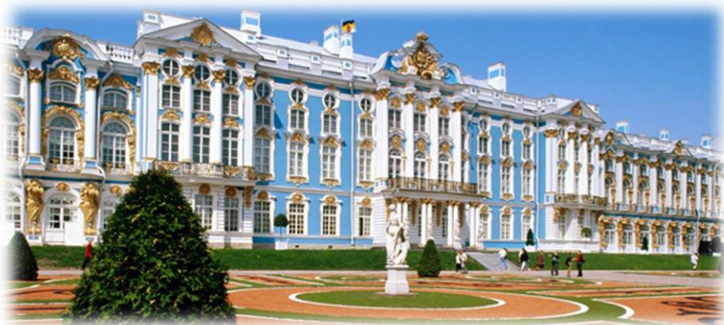
Palazzo di Caterina - Pushkin

Pensione completa. Al mattino escursione a Petrodvorest antica residenza estiva degli zar di Russia, con visita del Parco e Fontane. Rientro in città e giro in battello sui canali. Rientro infine in albergo. Pernottamento.