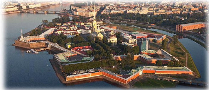
Fortezza SS Pietro e Paolo

Pensione completa. San Pietroburgo, la metropoli più nordica d'Europa, con i suoi 5 milioni di abitanti sorge sul delta del fiume Neva. La città, elegante e misteriosa è frutto della grandezza ma anche della tirannia dello zar Pietro Il Grande, in soli trecento anni è entrata a far parte della storia per la sua bellezza, per il suo splendido museo, per i suoi cittadini, per la sua sofferenza. Mattina dedicata alla visita panoramica di S. Pietroburgo : il Piazzale delle Colonne Rostrate, la Piazza del Palazzo, la Prospettiva Nevski, il Campo di Marte (splendido giardino), la Colonna di Granito. Nel pomeriggio visita della Fortezza dei SS. Pietro e Paolo così chiamata in onore dei santi protettori degli zar, voluta come fortezza da Pietro il Grande. Pernottamento.