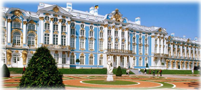
Palazzo di Caterina - Pushkin

Pensione completa. Al mattino escursione a Petrodvorec antica residenza estiva degli zar di Russia, con visita del Parco e Fontane. Rientro in città e giro in battello sui canali. Rientro infine in albergo. Pernottamento.