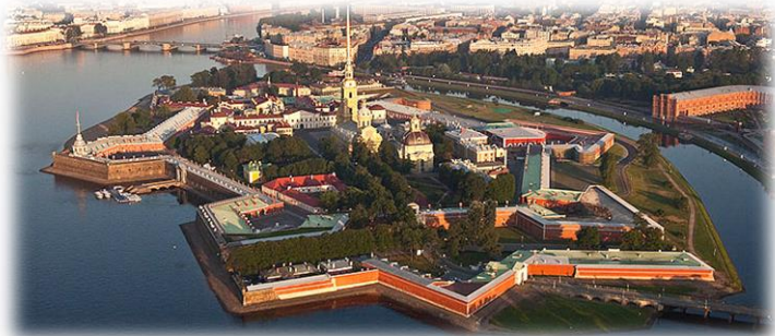
Fortezza SS Pietro e Paolo

Pensione completa. San Pietroburgo, la metropoli più nordica d'Europa, con i suoi 5 milioni di abitanti sorge sul delta del fiume Neva. La città, elegante e misteriosa è frutto della grandezza ma anche della tirannia dello zar Pietro II Grande, in soli trecento anni è entrata a far parte della storia per la sua bellezza, per il suo splendido museo, per i suoi cittadini, per la sua sofferenza. Mattina dedicata alla visita panoramica di S. Pietroburgo : il Piazzale delle Colonne Rostrate, la Piazza del Palazzo, la Prospettiva Nevski, il Campo di Marte (splendido giardino), la Colonna di Granito. Nel pomeriggio visita della Fortezza dei SS. Pietro e Paolo così chiamata in onore dei santi protettori degli zar, voluta come fortezza da Pietro il Grande. Pernottamento.