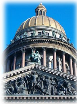
Cattedrale S. Isacco